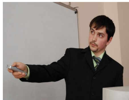
Фото 4. Выступает участник симпозиума на секции «Гидрогеология и инженерная геология»

В числе тех, кто учился и работал в стенах горно-геологической школы ТТИ-СТИ-ТИИ-ТПИ-ТПУ-21 Герой социалистического труда, 14 лауреатов Ленинской премии, 60 Лауреатов Государственной премии, 32 Заслуженных деятеля науки, 33 кавалера Ордена Ленина, 3 первых секретаря обкома КПСС, 1 Министр и 5 заместителей Министра, 48 Заслуженных геологов РФ. Горно-геологическую школу прославили более 350 первооткрывателей месторождений. История