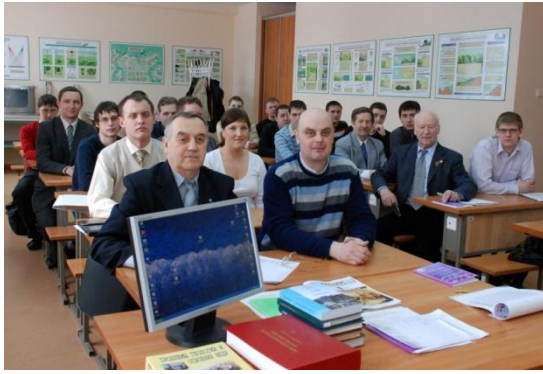
Фото 3. Работа секции «Горное дело»

впоследствии явился создателем Сибирской горнотехнической школы, в числе выпускников которой – 14 Героев Социалистического труда!