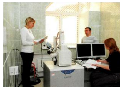
Фото 7. Электронный микроскоп Инновационного образовательного центра «Урановая геология»

Учиться в ИГНД престижно и интересно. У нас прекрасная библиотека, во многих корпусах есть аудитории, подключенные к беспроводному Интернету. Созданы все условия для занятия спортом, и культурная жизнь здесь просто кипит: конкурсы, концерты, фестивали. Для студентов имеются хорошие общежития, где предусмотрены тренажерные залы. Словом, есть все для всестороннего развития личности, и мы уделяем этому большое внимание.