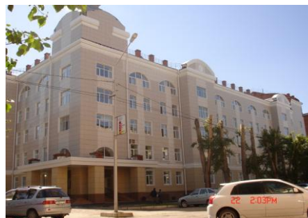
Фото 3. 20 корпус ТПУ - Институт геологии и нефтегазового дела