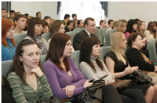
Фото 1. Открытие XIII международного молодежного симпозиума «Проблемы геологии и освоения недр»-2009 г., посвященного 110-летию со дня рождения профессора К.В. Радугина