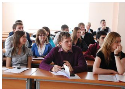
Фото 9. Работа секции «Геология и нефтегазовое дело» на английском языке