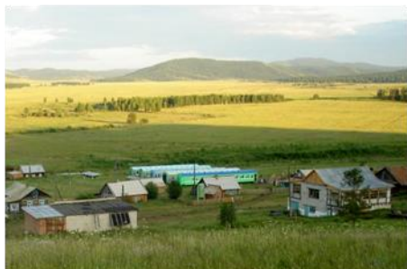
Фото 4. Центр учебно-геологических практик ИГНД имени Г.А. Иванкина в Хакасии

опережающей подготовки. Это Инновационный научно-образовательный Центр опережающей подготовку специалистов трубопроводного транспорта нефти и газа и Центр урановой геологии, где готовят специалистов высокого уровня в сфере поиска, разведки и разработки редкоземельного и уранового сырья.