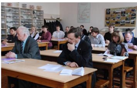
Фото 8. XIII Международный молодежный научный симпозиум «Проблемы геологии и освоения недр»-2009. Работа секции «Месторождения полезных ископаемых»

Чем привлекают наши выпускники такие компании? Это, прежде всего, уровнем знаний, полученных в ИГНД, по которым они не уступают выходцам из зарубежных образовательных центров, а в чем-то, думаю, и превосходят их. Кроме того, языковая подготовка у наших выпускников достаточно высокая. У нас есть своя кафедра иностранных языков, превосходный лингафонный кабинет. Государственный стандарт предполагает двухлетнее обучение иностранным языкам в технических вузах, у нас же ребята совершенствуют знание языков на протяжении 4 лет. Они свободно читают в подлиннике литературу по специальности. Ежегодно не