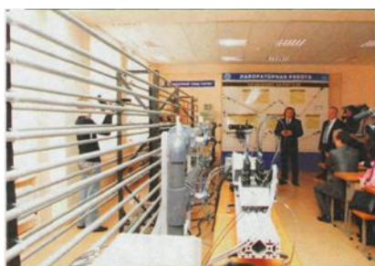
Фото 6. Лаборатория гидрогазодинамики ИГНД

Коллектив сотрудников ИГНД много работает по совершенствованию учебного процесса для подготовки высококлассных специалистов мирового уровня. Мы существенно обновили не только учебно-лабораторную базу, но и ведем большую работу по совершенствованию учебных программ. Программы постоянно совершенствуются, вбирают все лучшее, что накоплено в мире. Мы закупаем программное обеспечение ведущих производителей и т.д. В то же время мы сохраняем традиции в плане совмещения теории и практики, поскольку науку и образование нельзя отрывать от производства. У нас подготовка специалистов традиционно идет в единстве образования – наука – производство. Каждое лето студенты ИГНД ведут полевые исследования, выезжают на полигон, а старшекурсники, получив рабочую профессию, проходят практику на нефтепромыслах, в геологических и буровых компаниях. Это важный момент: ребята осматриваются и начинают понимать, что их ожидает на производстве.