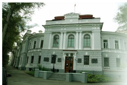
Фото 2. Первый корпус ТПУ - горный

В современных условиях сегодня ИГНД ТПУ, сохраняя богатейшие традиции прошлого, продолжают активно развиваться. Мы постоянно в движении, поиске. Мы не останавливаемся на достигнутом и не почиваем на лаврах. Это привлекает молодых, тех, кто решает связать свою жизнь с работой на кафедрах и в лабораториях института. К нам приходит много молодежи. И этот сплав молодости и опыта как раз и приносит, я считаю, ощутимые результаты. Есть устои, вековые традиции в ИГНД, и есть приток свежих сил. Эта энергия молодых, позволяющая развиваться нам и далее. Актуальными, кроме того, остаются идеи, наработки наших ученых. Мы имеем общепризнанные в России научные школы. Назову некоторые из них: школа профессора А.Ф. Коробейникова по изучению золота и платины, школа профессора С.Л. Шварцева, видного специалиста в области гидрогеохимии. Сюда же следует отнести направление, которое связано с именем профессора Д.С. Микова, основателя сибирской школы геофизиков. А есть еще школа радиогеохимика профессора Л.П. Рихванова, и другие ведущие направления. Но не только академическая наука, в ИГНД широко ведутся исследования и в прикладном направлении. В своей работе мы используем передовое оборудование, новейшие технологии. Большой объем научных исследований обусловлен заказом промышленных структур: у нас очень тесная связь с производством. Мы решаем для него задачи, и средства, полученные этим путем, направляем на техническое оснащение, поддержку молодых преподавателей и ученых.