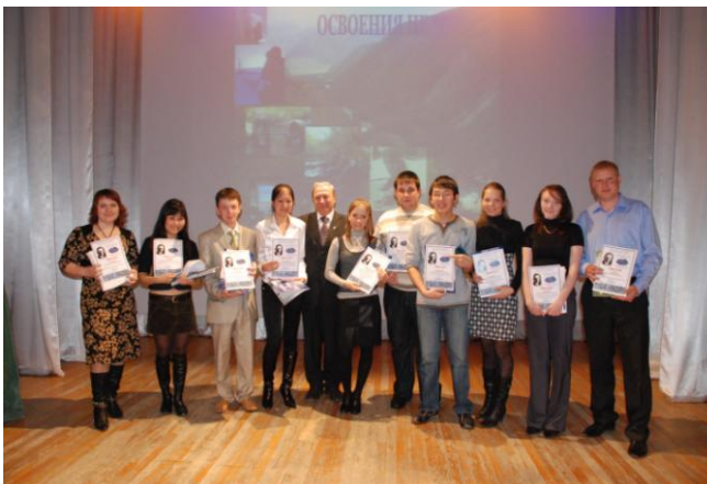
Фото 5. Лауреаты секции «Геоэкология»

Сегодня преемником горного отделения ТТИ является Институт геологии и нефтегазового дела Томского политехнического