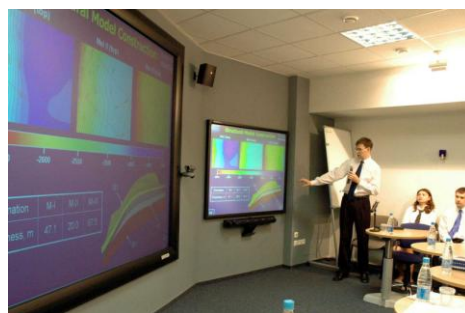
Фото 5. Зал с системой 3D-визуализации Инновационного научно-образовательного Центра ИГНД по подготовке специалистов трубопроводного транспорта нефти и газа

В 2007 г. Томский политехнический институт выиграл грант по реализации национального проекта «Образование». Более 100 млн рублей тогда было направлено на приобретение научно-исследовательского и учебного оборудования. Это позволило сделать реальными образовательные проекты, о которых мы заявляли. В составе ИГНД появились две элитные образовательные площадки – их называют еще центрами