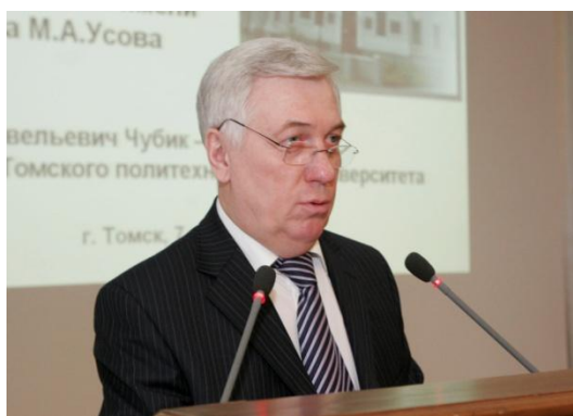
Фото 1. С приветственным словом к участникам XIII Международного симпозиума «Проблемы геологии и освоения недр» обращается ректор Томского политехнического университета П.С. Чубик

П.С. Чубик, профессор, ректор Томский политехнический университет, г. Томск, Россия