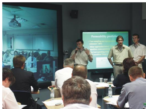
Зал 3D-визуализации. Защита геологами дипломных работ

Данная исследовательская работа является эквивалентом магистерской диссертации. Центр имеет современное техническое оснащение - более 150 персональных компьютеров, 5 рабочих станций