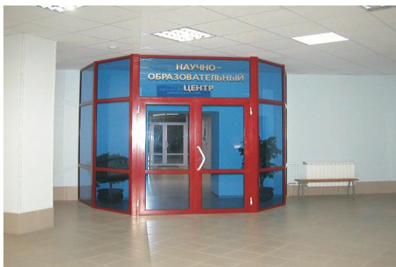
Вход в Центр

НК «ЮКОС» был открыт Центр профессиональной переподготовки специалистов нефтегазового дела. Обучение в Центре проводится на основе магистерских программ шотландского университета Heriot-Watt (Шотландия, г. Эдинбург). Центр осуществляет подготовку специалистов по трем направлениям: Нефтяной инжиниринг (MSc in Petroleum Engineering), Геология нефти и газа (MSc in Reservoir Evaluation) и Технология нефти и газа (MSc in Oil and Gas Technology). Обучение в Центре проходит в течение 12 месяцев и дает слушателям интегрированные знания и навыки командной