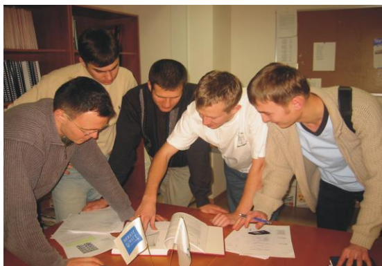
Студенты в библиотеке

Лекции читаются на английском языке профессорами Эдинбургского университета, а также аккредитованными преподавателями Центра. После завершения программ слушатели приобретают образование международного стандарта, степень магистра университета Heriot-Watt и диплом о профессиональной переподготовке Томского политехнического университета. Каждая магистерская программа состоит из 4-х семестров, во время которых слушатели посещают