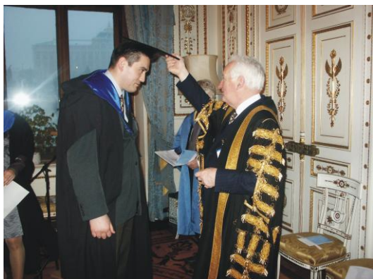
Вручение дипломов магистрам в Британском посольстве

Для студентов и преподавателей в Центре имеется своя библиотека, где собрана учебная литература по основным модулям, которые читаются во время обучения. Информация представлена на бумажных носителях, видеокассетах и компакт-