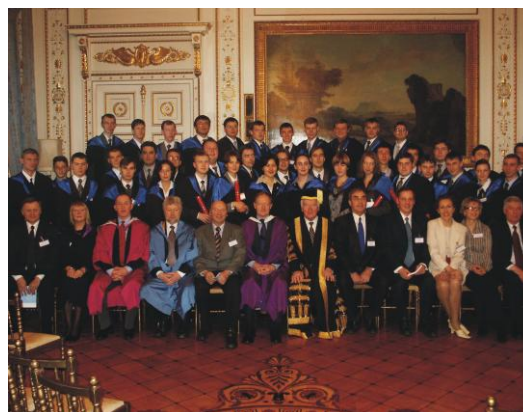
Выпускники ЦППСНД в посольстве Британии

На сегодняшний день уже третий набор слушателей готовится к получению магистерских дипломов. Выпускники Центра прошлых лет уже проявили себя как опытные и высококлассные специалисты в различных компаниях нефтяного сектора. Качественные знания и системность мышления делают выпускников конкурентоспособными на рынке труда.