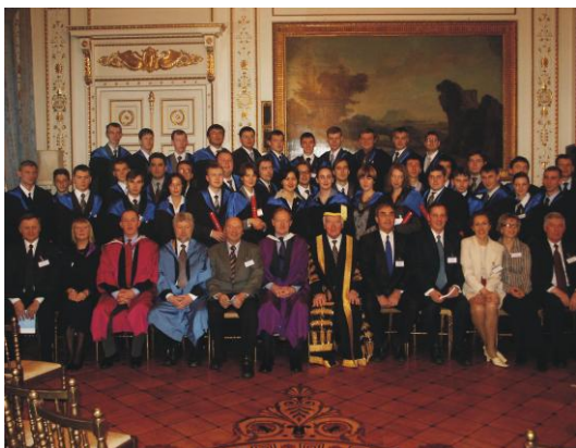
Выпускники ЦППСНД в посольстве Британии

Для студентов и преподавателей в Центре имеется своя библиотека, где собрана учебная литература по основным модулям, которые читаются во время обучения. Информация представлена на бумажных носителях, видеокассетах и компакт-дисках на русском и английском языках. Кроме этого, Центр располагает периодическими специализированными изданиями и справочной литературой. Библиотека постоянно пополняется новинками.