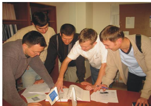
Студенты в библиотеке

Лекции читаются на английском языке профессорами Эдинбургского университета, а также аккредитованными преподавателями Центра. После завершения программ слушатели приобретают образование международного стандарта, степень магистра университета Heriot-Watt и диплом о профессиональной переподготовке Томского политехнического университета. Каждая магистерская программа состоит из 4-х семестров, во время которых слушатели посещают лекционные и практические занятия. Обучение ведется по основным специальным дисциплинам: нефтепромысловой геологии, геофизике, физике пласта, разработке месторождений, моделированию, технологии добычи, бурению и экономике. По каждой дисциплине студенты сдают письменные экзамены на английском языке. Знания, полученные в рамках теоретических модулей, затем