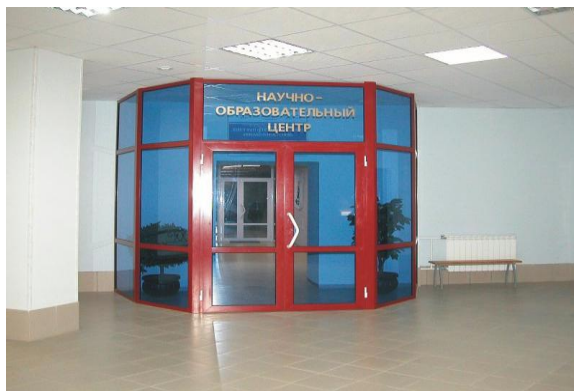
Вход в Центр

политехнического университета при поддержке НК «ЮКОС» был открыт Центр профессиональной переподготовки специалистов нефтегазового дела. Обучение в Центре проводится на основе магистерских программ шотландского университета Heriot-Watt (Шотландия, г. Эдинбург). Центр осуществляет подготовку специалистов по трем направлениям: Нефтяной инженеринг (MSc in Petroleum Engineering), Геология нефти и газа (MSc in Reservoir Evaluation) и Технология нефти и газа (Msc in Oil and Gas Technology). Обучение в Центре проходит в течение 12 месяцев и дает слушателям интегрированные знания и навыки командной работы, что является необходимым условием для