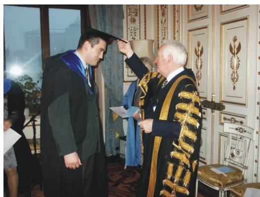
Вручение дипломов магистрам в Британском посольстве

реализуются на практике при выполнении группового проекта, главная цель которого – интеграция полученных знаний при работе с реальными промышленными данными. Студенты защищают свои групповые проекты перед экспертной комиссией. Имея все необходимое оборудование, Центр проводит видео-конференции с университетом Heriot-Watt в режиме реального времени. Поэтому в состав экспертной комиссии входят также и преподаватели из Эдинбурга. Более глубокие знания по выбранной специализации слушатели получают при работе над индивидуальными проектами, когда каждый студент проводит исследование по конкретной проблеме и по результатам работы подготавливает отчет. Индивидуальные проекты разрабатываются с учетом